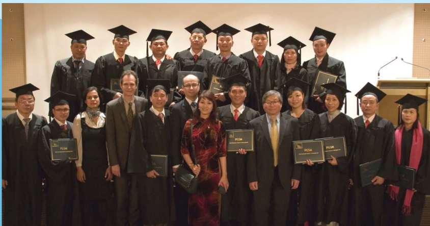
Lễ tốt nghiệp tại kinh đô Ánh sáng Paris vào tháng 2 hàng năm